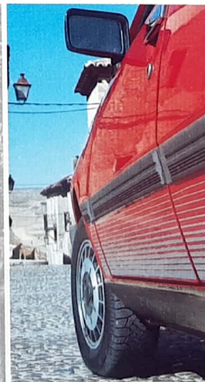
Protecciones laterales y espejo retrovisor regulable desde el interior.

Tan fuerte y rudo como la roca. Tan confortable como la paz y sosiego que esconde en su interior. El nuevo Renault 18 GTX posee valores que nunca mueren. Ni se deterioran con el tiempo. 1.995 cm 3 y 102 CV DIN de potencia. 5 velocidades y 185 Km/h. de velocidad punta. Equilibrado, fuerte y de líneas armoniosas y estéticas. Protecciones laterales, alerón trasero y un capó penetrante y agudo. En consonancia con un nivel superior. En armonía con el entorno.