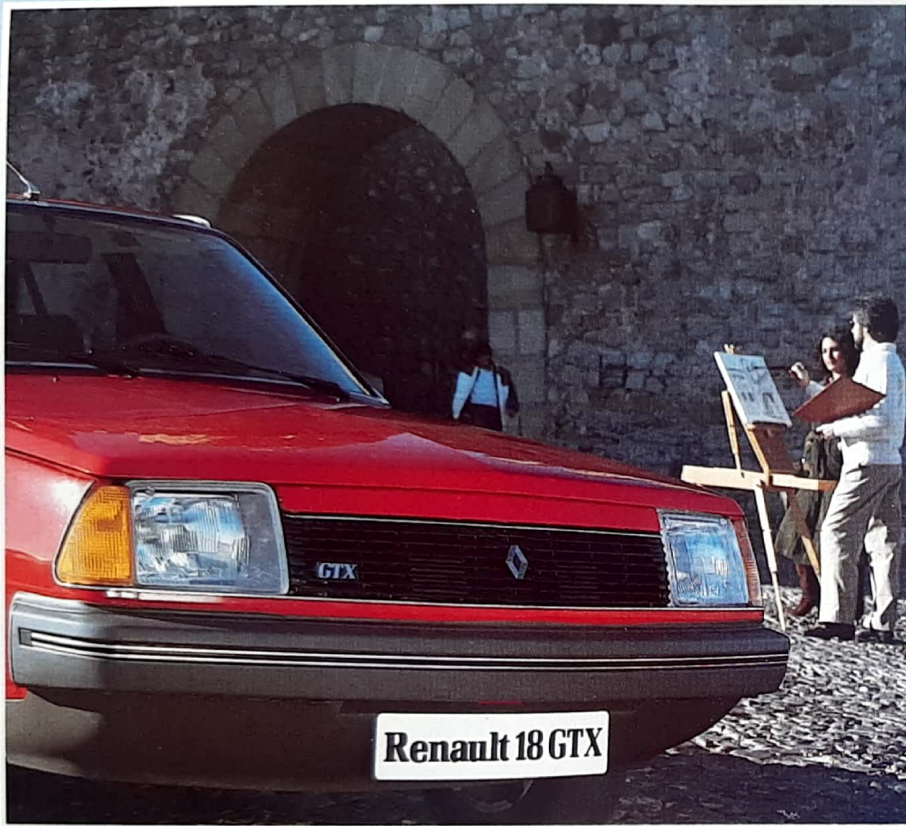
Faros halógenos, regulables desde el interior.