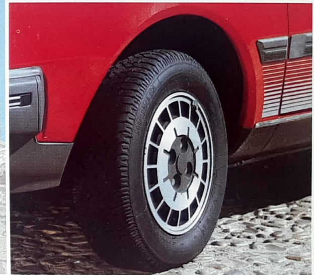
Blantas de aleación ligera, en opción.